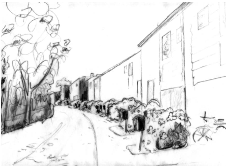
Skiss över en mer enhetlig entrésida