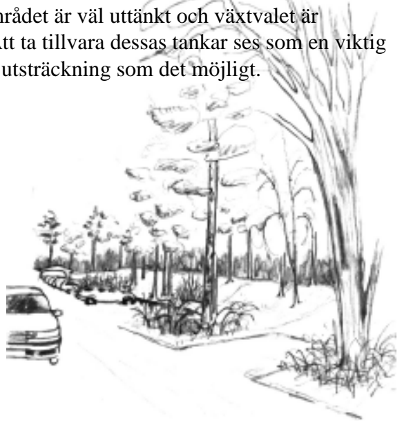
Skiss över hur parkeringarna tonas ner med hjälp av vegetation

Att restaurera och komplettera stomplanteringar är av största vikt för att återskapa husens ursprungliga karaktär. De naturlika områdena behöver även de en upprustning och en skötselplan som sträcker sig längre fram då en förnygring är av stor vikt för bevarandet av den naturlika delen. Landskapsarkitektens tanke bakom bostadsområdet är väl uttänkt och växtvalet är anpassat för att framhäva varje huslängas karaktär. Att ta tillvara dessas tankar ses som en viktig del i arbetet och att följa originalritningarna i så stor utsträckning som det möjligt.